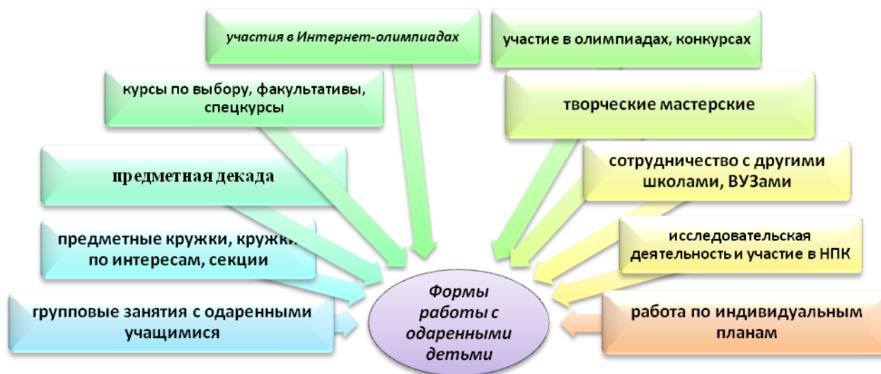
Рисунок 3. Формы работы с одаренными детьми

Расширение единого образовательного пространства - необходимое условия для проявления каждым ребенком своих творческих способностей, возможности самореализации в различных видах деятельности. В единой системе общего и дополнительного образования предполагается использовать следующие формы работы с одаренными детьми :