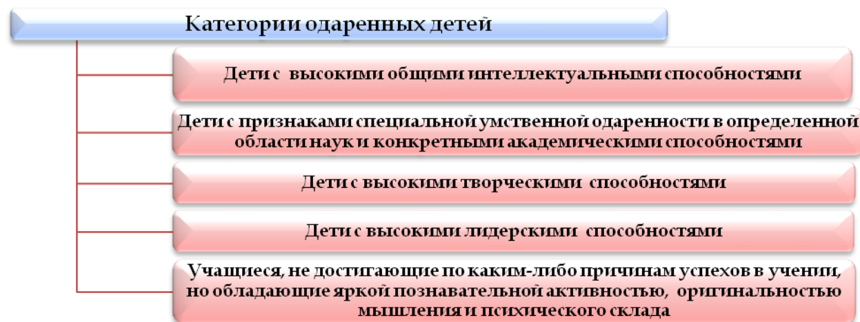
Рисунок 1. Категории одаренных детей

Стратегия работы с одаренными детьми заключается в создании условий для их оптимального развития, включая детей, чья одаренность ещё не проявилась, а также просто способных детей, в отношении которых есть надежда на дальнейшее развитие их способностей.